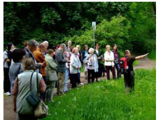
Exkursion an der Parthe

Erste Lösungsansätze reichen von einer optimierten Verwertung von Grünschnitt bis hin zu extensiven, ganzjährigen Beweidungskonzepten mit robusten Rinderrassen.