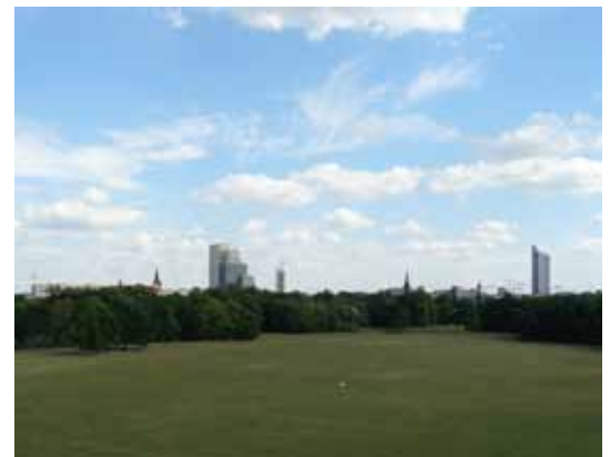
Das Rosental

Gleichzeitig stellt die Flussaue der Parthe mit ihren Wiesen, kleinen Waldstücken und öffentlichen Grünanlagen einen wichtigen Erholungsraum für die Bevölkerung und einen Rückzugsraum für viele Tier- und Pflanzenarten dar. Zu entdecken gibt es hier viel: Die die Partheaue umgebende weitläufige Agrarlandschaft wird strukturiert und belebt von zahlreichen Windschutzpflanzungen. Die Kuppen der Taucha-Eilenburger-Endmoräne sind in der Bevölkerung als markante Aussichtspunkte bekannt. Ehemalige Steinbrüche und Tongruben (z.B. an der Bergkirche Beucha) belegen die ursprüngliche Bedeutung des ländlichen Raumes als Baustofflieferant für die benachbarte Stadt und die gut erhaltenen historischen Dorfstrukturen (z.B. Gottscheina, Zweenfurth) zeugen von einer langen und bewegten Siedlungsgeschichte.