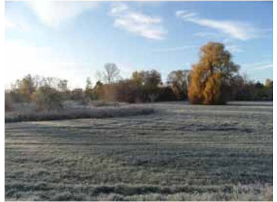
Die Partheaue bei Thekla

Aber das Partheland ändert sich rasant – wie die meisten anderen Landschaften in Deutschland. Diese Dynamik ist nicht allein auf die hohe Bautätigkeit im Raum zurückzuführen, sie ist ebenso von Veränderungen der Standortverhältnisse beeinflusst. Insbesondere in der Partheaue ist eine zunehmende Vernässung festzustellen, die einerseits eine Anpassung der Grünlandbewirtschaftung, andererseits von Naturschutzziele erfordert. Die überwiegend in den 50er und 60er Jahren gepflanzten Windschutzpflanzungen sind mittlerweile so alt, dass ihr Fortbestand nur durch gezielte Pflege und Nachpflanzungen zu sichern ist. Da sich jedoch auch die ökonomischen Rahmenbedingungen für die Landwirtschaft und die Landschaftspflege stark verändert haben, sind naturschutzorientierte Bewirtschaftungsformen und die Pflege wertvoller Landschaftselemente nicht mehr rentabel.