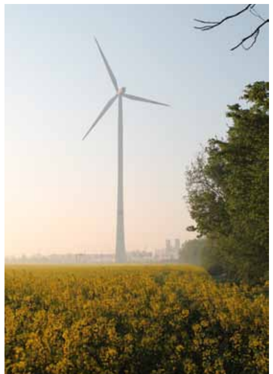
Agrarlandschaft und BMW-Werk

Dieser komplexe Arbeits- und Kommunikationsprozess zum Schutz, zur Entwicklung und Inwertsetzung von Kulturlandschaften wird als Kulturlandschaftsmanagement bezeichnet und ist zentraler Gegenstand des Forschungsvorhabens „stadt PARTHE land“.