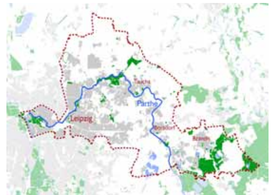
Der Untersuchungsraum Partheland