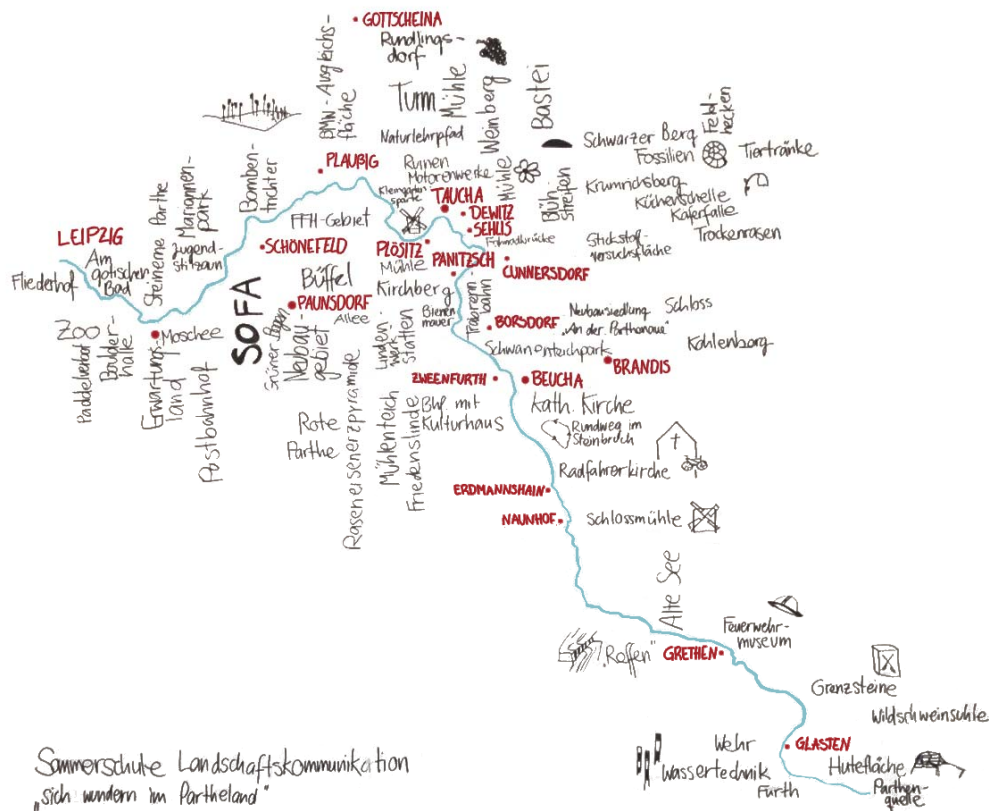
Abb. 1: Parthelandkarte – erarbeitet von Studenten der TU Dresden im Rahmen der Sommerschule 2016