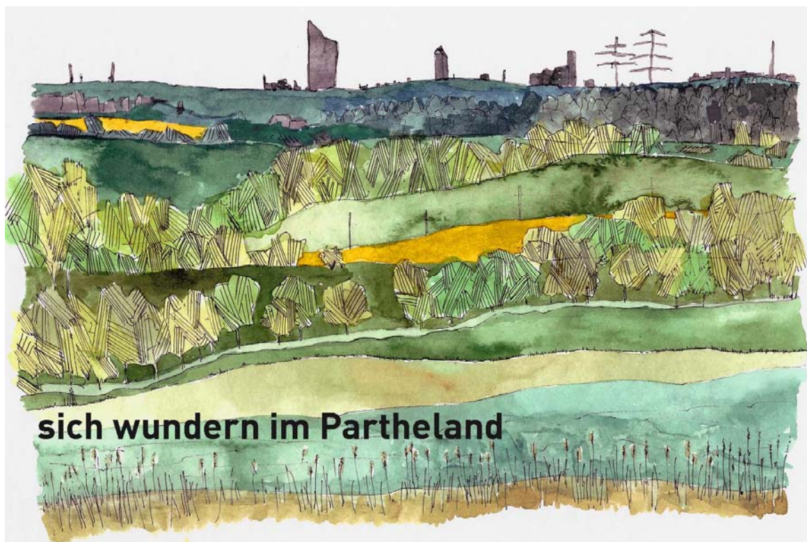
Abb. 3: Titelblatt zum Exkursionsführer, der im Herbst 2016 erscheinen soll